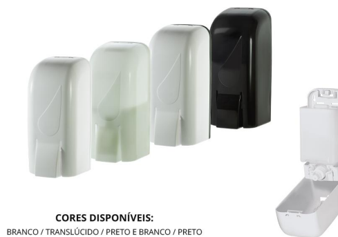
CORES DISPONÍVEIS: BRANCO / TRANSLÚCIDO / PRETO E BRANCO / PRETO

CAPACIDADE: 1 LITRO ABERTURA: CHAVE MATERIAL: RESINA TERMOPLÁSTICA DE ALTA RESISTÊNCIA DIMENSÕES DO PRODUTO: COMP.: 11 cm x LARGURA: 10 cm x ALTURA: 23,5 cm