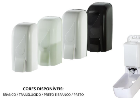
CORES DISPONÍVEIS: BRANCO / TRANSLÚCIDO / PRETO E BRANCO / PRETO

CAPACIDADE: 1 LITRO ABERTURA: CHAVE MATERIAL: RESINA TERMOPLÁSTICA DE ALTA RESISTÊNCIA DIMENSÕES DO PRODUTO: COMP.: 11 cm x LARGURA: 10 cm x ALTURA: 23,5 cm