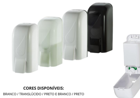
CORES DISPONÍVEIS: BRANCO / TRANSLÚCIDO / PRETO E BRANCO / PRETO

CAPACIDADE: 1 LITRO ABERTURA: CHAVE MATERIAL: RESINA TERMOPLÁSTICA DE ALTA RESISTÊNCIA DIMENSÕES DO PRODUTO: COMP.: 11 cm x LARGURA: 10 cm x ALTURA: 23,5 cm