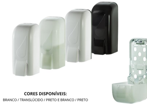
CORES DISPONÍVEIS: BRANCO / TRANSLÚCIDO / PRETO E BRANCO / PRETO

CAPACIDADE: REFIL DE 800ml ABERTURA: CHAVE MATERIAL: RESINA TERMOPLÁSTICA DE ALTA RESISTÊNCIA DIMENSÕES DO PRODUTO: COMP.: 11 cm x LARGURA: 10 cm x ALTURA: 23,5 cm